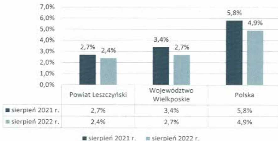
Porównanie stopy bezrobocia

Duże znaczenie w radzeniu sobie na trudnym i stale zmieniającym się rynku pracy ma wiek osób poszukujących zatrudnienia. Największe problemy w tej dziedzinie mają osoby ze skrajnych grup wiekowych, tzn. osoby młode do 30 roku życia (26,1% ogółu zarejestrowanych), dopiero wkraczające na rynek pracy, a także osoby starsze powyżej 50 roku życia (22,9% ogółu zarejestrowanych), zmuszone do ciągłego udowadniania swojej atrakcyjności na rynku pracy.